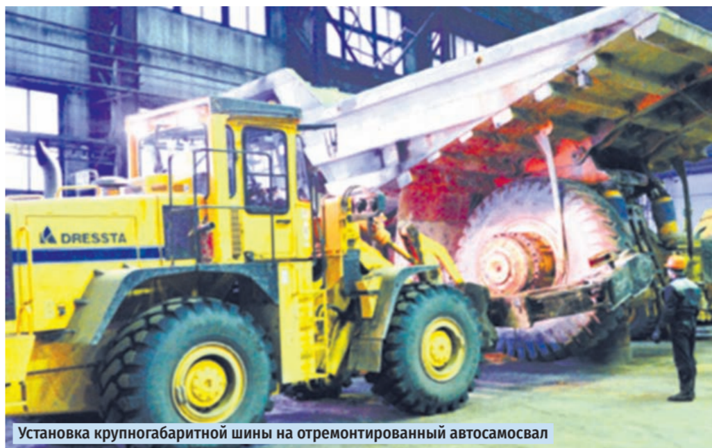
Установка крупногабаритной шины на отремонтированный автосамосвал

ням подразделений комбината ГСМ, доставке материалов для выполнения строительных-монтажных работ, круглосуточному обеспечению дежурного персонала цехов транспорта, обеспечению горячим питанием в карьере, доставке продуктов питания по цехам, по доставке питьевой воды. Этот относительно небольшой по составу, но мобильный автотранспорт обеспечивает многочислен-